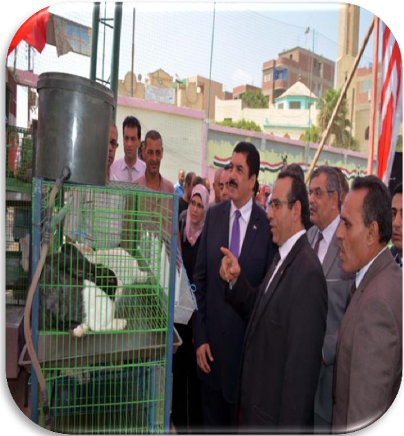
صور الخدمات التعليمية ومحو الأمية