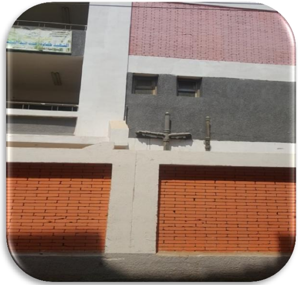
(مدرسة الشهيد محمود عبد العظيم) (قبل التطوير)