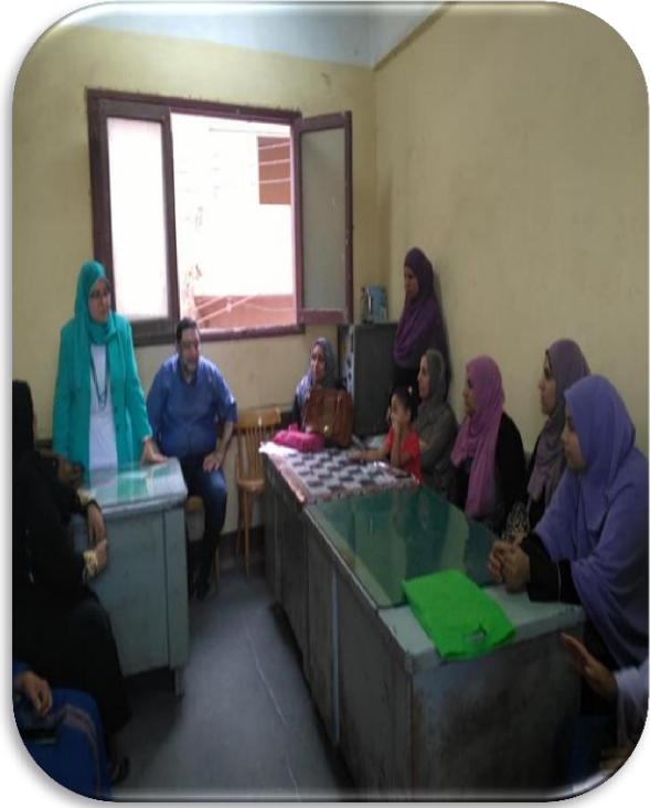
صور حملات توعية (قامت بها كليات الطب البشري - التمريض - الطب البيطري - التربية - التربية الرياضية)