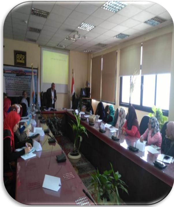
صور المرحلة الأولى من المبادرة الرئاسية "صناعية مصر"