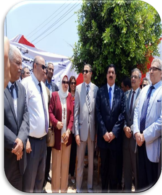
صور الخدمات الصحية : ( قام بها كلية الطب – كلية التمريض – مديرية الشؤون الصحية – مكتب أغذية بنها التابع لمكتب الصحة )